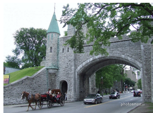
Porte St-Jean, Québec