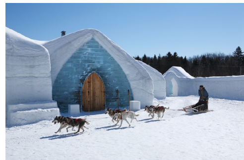
Hôtel de glaces de Québec