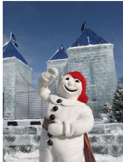
Bonhomme Carnaval, le plus gros carnaval d'hiver au monde