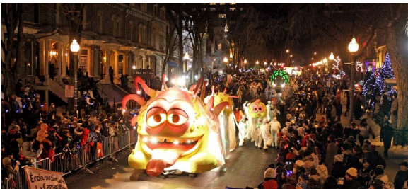
Parade de nuit du Carnaval