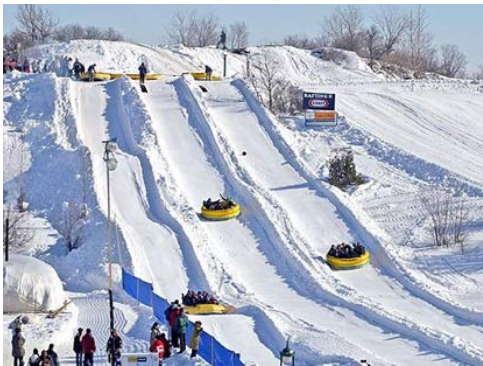
Glissade de Québec