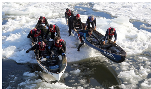
Traversée de Québec à Lévis