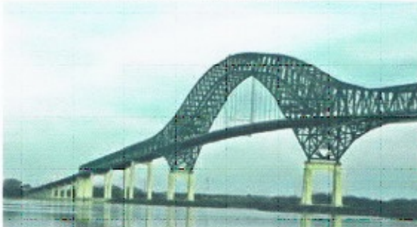
Pont Laviolette de Trois-Rivières