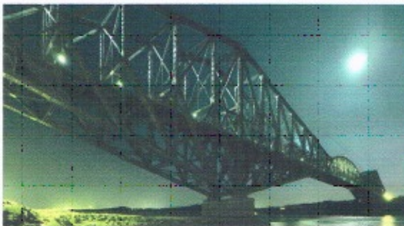
Pont de Québec, Québec